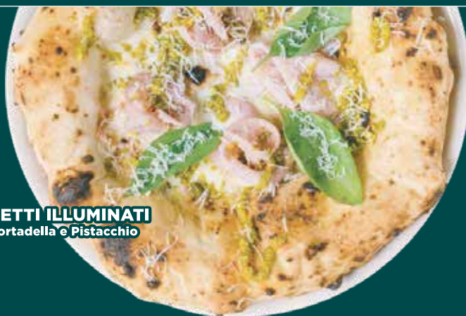
LA TETTI ILLUMINATI con Mortadella e Pistacchio

Pomodorino cotto a bassa temperatura, Fiordilatte dei Monti, melanzane a funghetto. In uscita: Cuore di Burrata, olio e basilico